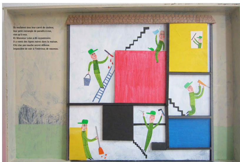
Le jeu des différences et des ressemblances.